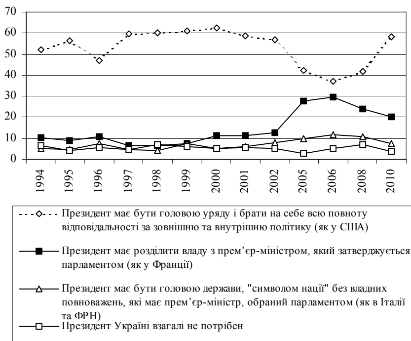
Рис. 2. Динаміка думок населення щодо обсягів президентських повноважень (%)

Складність цих процесів посилюється ще й тим, що одночасно з політичною реформою після президентських виборів 2004 р. політичне розмежування українського суспільства наклалося на ціннісно-світоглядне розшарування ідентичностей. Цей феномен привів до суттєвих зрушень масових настроїв стосовно функціонування політичних інститутів, зокрема розподілу влади між Президентом і парламентом. Як свідчить динаміка відповідей населення України на запитання “Якою, на Вашу думку, має бути роль Президента в Україні?”, за результатами соціологічного моніторингу Інституту соціології НАН України в середині 2000-х років відбулося зниження підтримки варіанта абсолютної президентської влади (рис. 2).