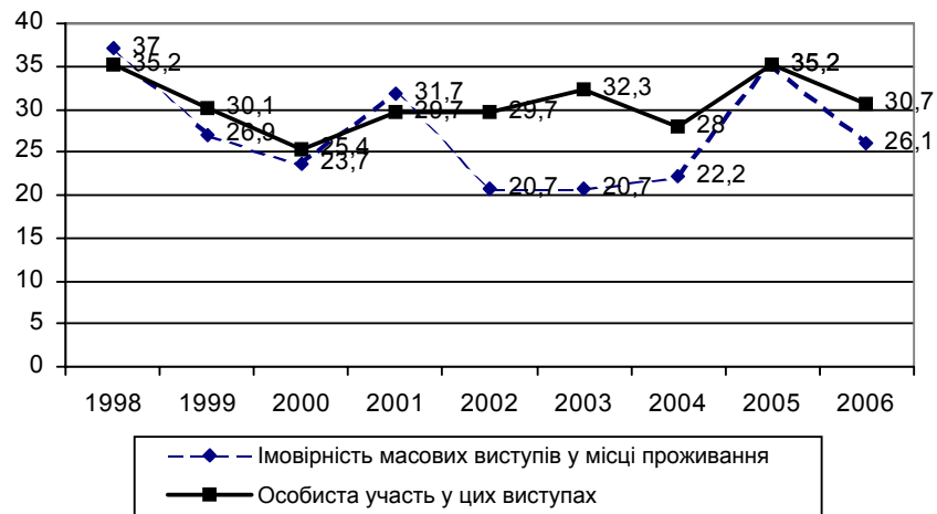
Рис. 4.2. Динаміка оцінок населенням можливості виникнення протестів та можливості особистої участі, 1998–2006 роки

Цікаво, що від 2001 року декларативна готовність взяти особисту участь у масових виступах проти падіння рівня життя, на захист своїх прав перевищує (за винятком 2005 року) очікування таких виступів у місцях проживання (див. рис. 4.2). Ці показники є досить вагомими за величиною, і це ще раз доводить тезу про певну активізацію населення України.